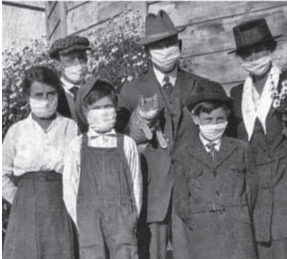
Foto che ci fa molto riflettere. Anni '20 Anno 2020 Come non abbiamo imparato nulla dalla storia. Grazie a chi l'ha trovata Foto di famiglia durante gli anni '20 e l'influenza spagnola. Notare il gatto, please....

Fuente: Bauso, Matias, “ Las imágenes de hace 100 años de la gripe española que parecen hechas hoy en tiempos de coronavirus ”.