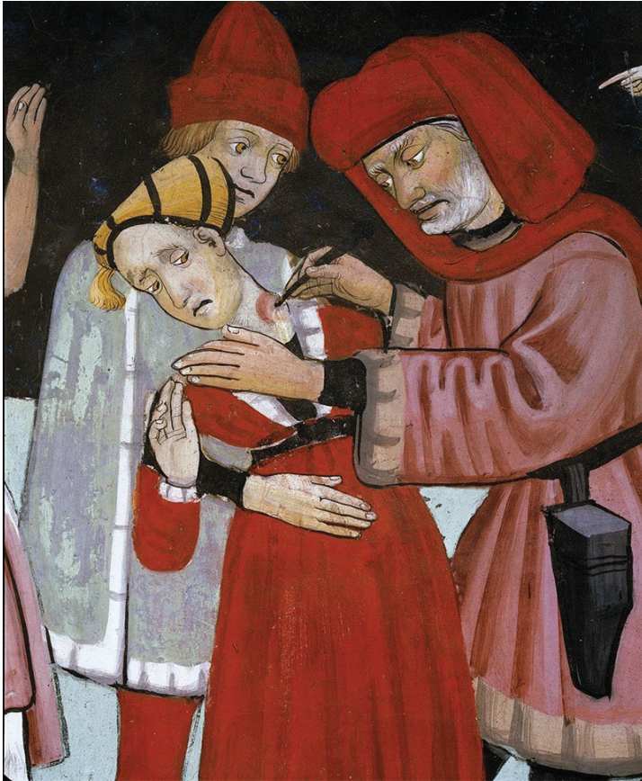
Imagen 1. La peste del siglo XIV: localización de bubón ("The 14th century plague")

Fuente: Autor desconocido. 14?? Localización: Capilla de San Sebastián (Lanslevillard, Francia).