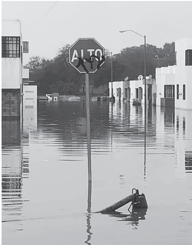
Fotografía 1. Conjunto de viviendas afectadas por inundación a causa de lluvias en un Fraccionamiento de San Luis Potosí, S.L.P.