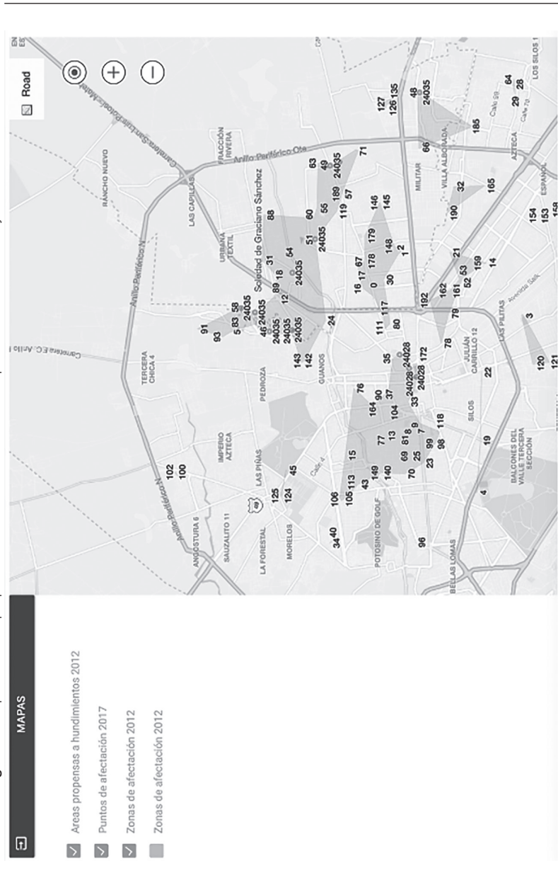
Figura 2. Mapa de zonas propensas a hundimientos del municipio de San Luis Potosí y zona conurbada.