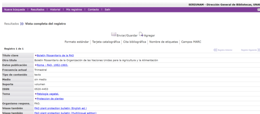
Figura 6. Edición en español