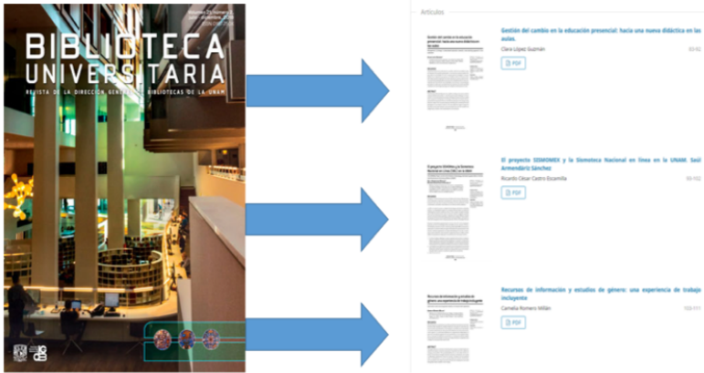
Figura 2. Manifestación agregada