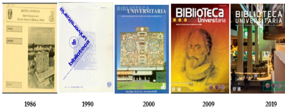
Figura 1. Relación todo/parte