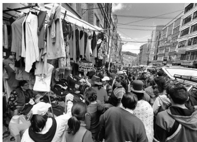
Imagen 1. Comerciantes informales antes de la cuarentena