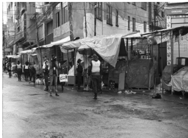
Imagen 2. Comerciantes informales durante de la cuarentena