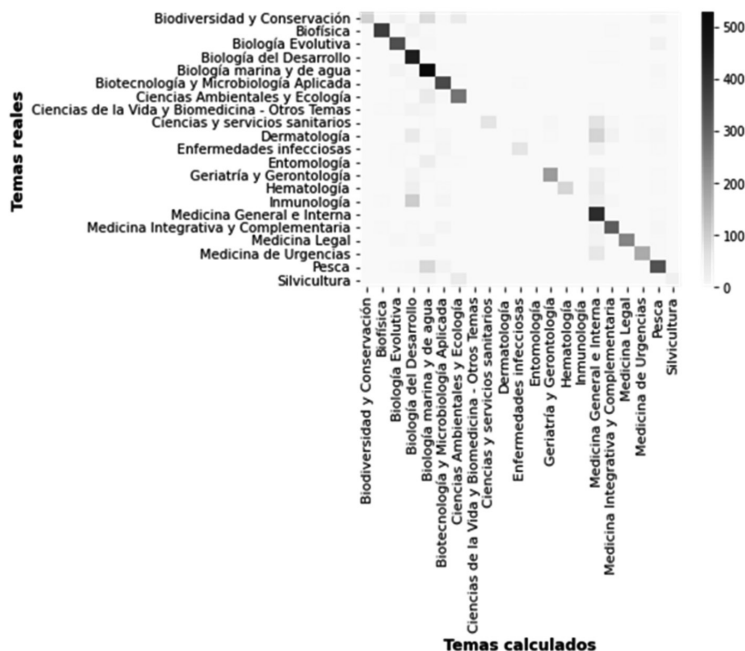
Figura 3. Matriz de confusión del algoritmo propuesto

En la Figura 3 se presenta la matriz de confusión del algoritmo propuesto.