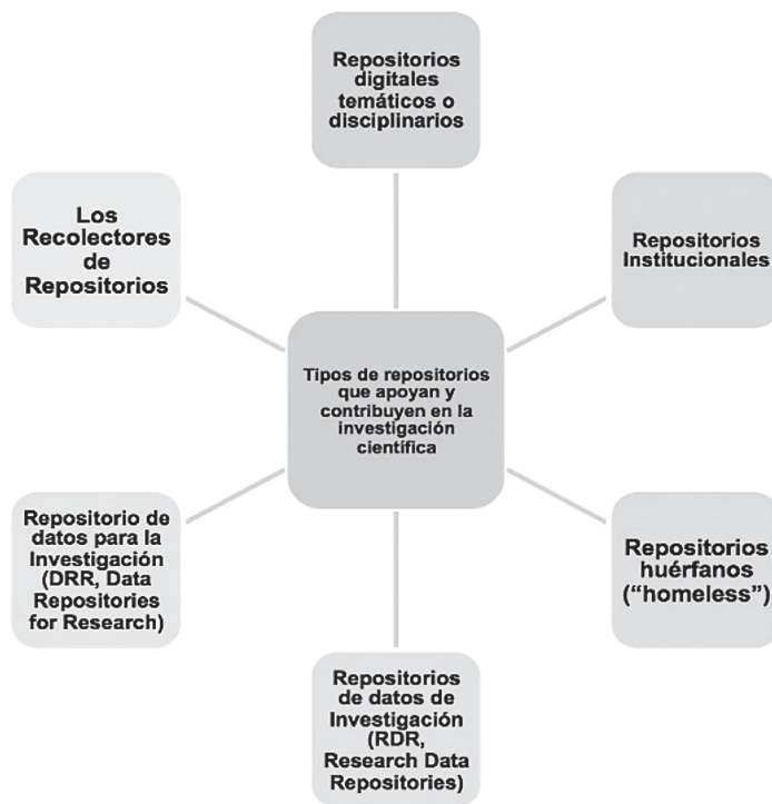
Figura 1. Tipología de los Repositorios 1