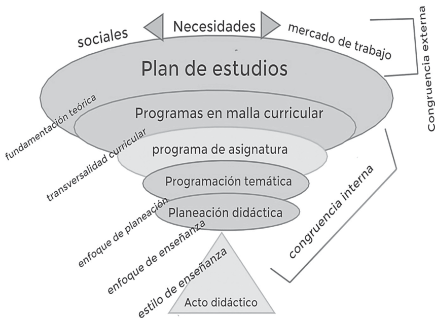
Figura 2. Elementos que articulan la congruencia de los elementos educativos

Toda planeación didáctica desemboca en una puesta en escena, en la ejecución de lo planeado denominado acto didáctico, que es el momento en el cual los docentes, discentes y contenidos, enmarcados en un contexto determinado, se activan en una inercia didáctica a través de actividades, dinámicas y técnicas, para alcanzar un objetivo de enseñanza y de aprendizaje.