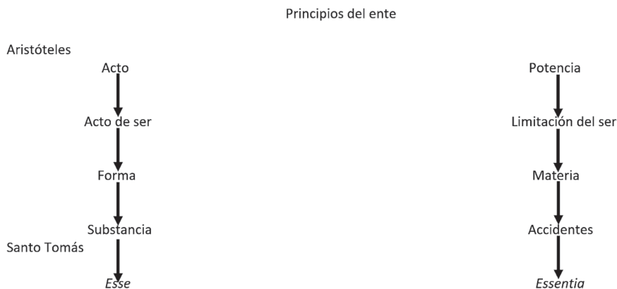
Esquema 1. Comparación de los principios del ente en Aristóteles y Santo Tomás.

El Aquinate agrega un par en los principios del ser: Esse y Essentia . El ser como acto de ser, y la esencia como limitación de ese ser.