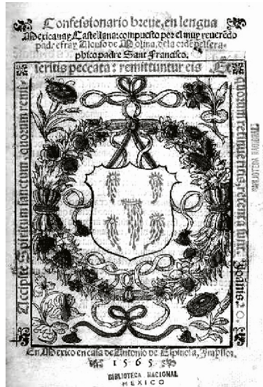
Confesionario breve, 1565

México de 1556 a 1589. Se expone, igualmente, la necesidad de gramáticas latinas y otros libros que en su mayoría fueron traídos de Europa, y cuya presencia se comprueba en las colecciones novohispanas que se conservan en las bibliotecas, pero que también repercutieron en las imprentas mexicanas, las que publicaron confesionarios, sermonarios, una gramática latina y libros de liturgia.