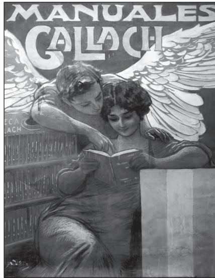
Figura 5. Cartel de los Manuales Gallach. Original de Antonio Utrillo.

En 1916 se publicó el número 100 ( Manual del pintor decorador por José Cuchy) y para la venta a plazos del conjunto se diseñó un mueble modernista. En agosto de 1918, momento en que Calpe comenzó su actividad, salió el número 106, y a partir de entonces la media anual fue de 5 títulos. Su demanda fue constante y durante meses, hasta que se crearon las nuevas colecciones, fue uno de los pilares económicos de la editorial. Las tiradas medias oscilaron entre los 3000 y 4000 ejemplares, con constantes reimpressiones. Después de la fusión entre Calpe y Espasa en el año 1925 se decidió limitar la colección a 130 títulos, sustituyendo los de escasa venta por otros nuevos con el mismo número, lo que ocasionó confusión entre los clientes.