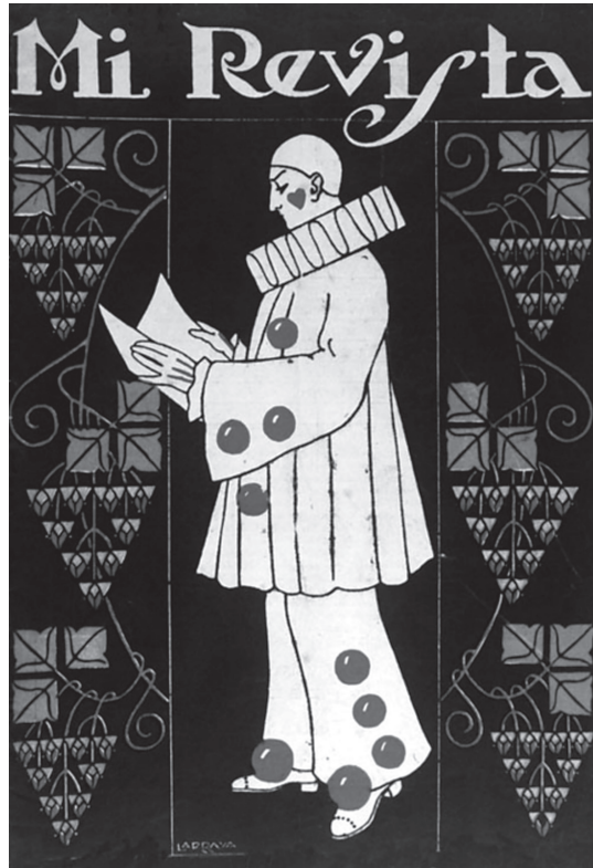
Figura 3. Portada de Mi Revista, 1919.