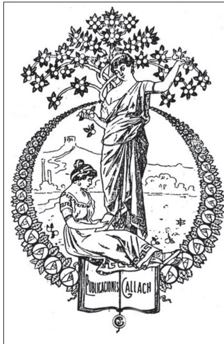
Figura 1. Logotipo de la editorial Gallach, h. 1900.

La editorial Gallach tuvo su origen en el deseo de José Gallach Torras de poner en marcha un negocio de producción y distribución de libros, en un periodo de cambio en la industria propiciado por las nuevas tecnologías. Gallach nació en Barcelona el 30 de marzo de 1872, hijo del impresor del mismo nombre del que aprendió las artes gráficas ( Figura 1 ).