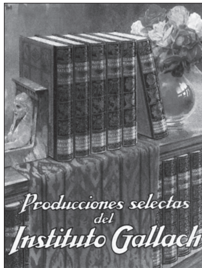
Figura 6. Catálogo de las Producciones Selectas del Instituto Gallach, h. 1930.

existencia había sido premiado con Medalla de Oro en la Exposición Internacional celebrada en Barcelona en 1929. Por entonces se habían editado tres grandes obras: Razas Humanas (2 tomos, 1924), Historia Natural (4 tomos, 1925) y Geografía Universal (5 tomos, 1928), y se encontraba en proyecto Historia Universal (6 tomos, 1931). Estas cuatro obras compusieron el catálogo general titulado Producciones Selectas, creado para presentar la serie.