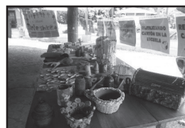
Fotografías de los talleres

Paralelamente se gestionó la participación del Instituto Costarricense sobre Drogas, (ICD), el cual, se trasladó hasta la comunidad, con la finalidad de que en esta oportunidad, los beneficiados en recibirla fueran los y las docentes del circuito.