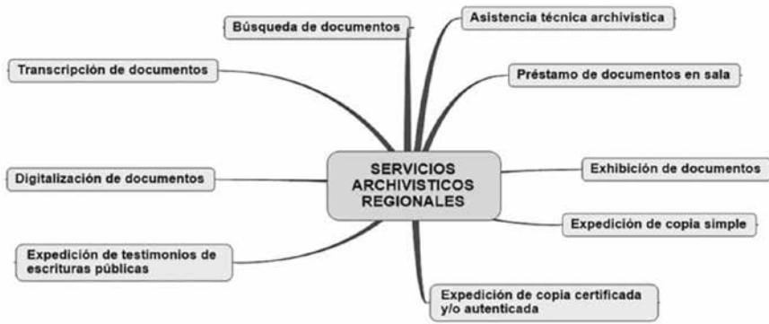
Figura 5. Servicios archivísticos de los archivos regionales

Fuente: AGN. Guía General de Archivos, 2012. Elaboración propia