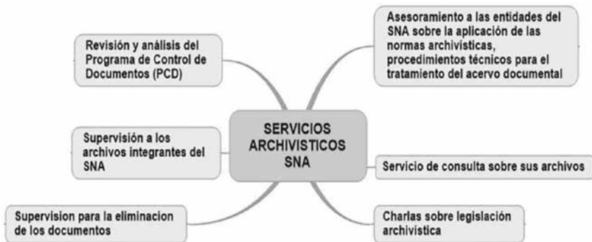
Figura 4. Servicios archivísticos del AGN para el Sistema Nacional de Archivos-SNA