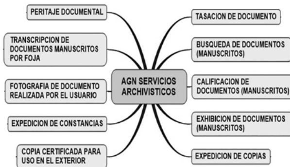
Figura 3: Servicios archivísticos AGN

A manera de ejemplo, sobre los servicios archivísticos podemos reconocer los que ofrece el Archivo General de la Nación, institución pública encargada de acopiar los bienes culturales y conservar el legado documental de la nación peruana, por estas características su función principal es la custodia, organización y tratamiento de los documentos. Los servicios archivísticos de la AGN se presentan en la siguiente figura: