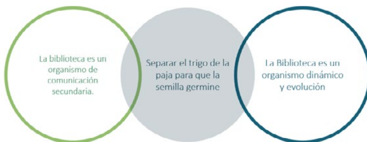
Ilustración 5. Premisas de los teóricos de la bibliotecología.

Ortega y Gasset (1935) aporta a nuestra reflexión la necesidad de saber separar el “trigo de la paja”, con lo cual se enfatiza en la necesidad de las habilidades de selección y evaluación de información como esenciales a partir de las bibliotecas. Es importante mencionar que se ha desarrollado un intenso trabajo orientado hacia el desarrollo de las habilidades para saber utilizar la información, lo que implica saber acceder, evaluar y comunicar éticamente. Sin embargo, pareciera que los impactos generados en la formación de una conciencia digital crítica no ha sido la esperada debido a que se tratan de acciones desarticuladas y sin seguimiento y refuerzo desde escenarios educativos formales.