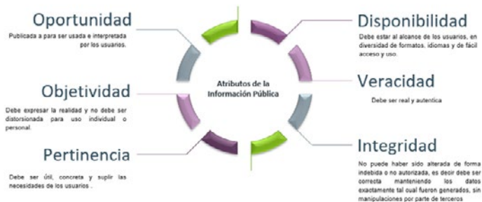
Ilustración 1. Atributos de la información pública.

Por ello, la información pública cumple con los siguientes atributos, como los mencionados en la ilustración 1, en la que están presentes la pertinencia, entendida como la utilidad, la integridad, la completud y no alteración de su contenido, que es acompañada de la veracidad y disponibilidad, entendidas como la autenticidad y el estar al alcance de los ciudadanos en oportunidad y objetividad.