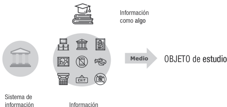
Ilustración 1. Interpretación del Sistema de Información.