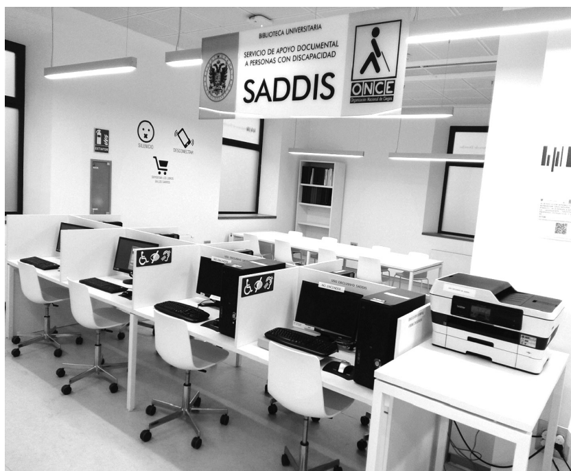
Figura 3. SADDIS de la Universidad de Granada

Zoomtext, y algún periférico adaptado (teclado, joystick , etc.). La Universidad de Sevilla (US) menciona 14 puestos informáticos “con ayudas visuales”, sin concretar cuáles. La UGR (Figura 3) ofrece un espacio compuesto por cinco ordenadores con Jaws, NVDA, un escáner OCR y un lector DAISY, al que llama SADDIS (Servicio de Apoyo Documental a personas con Discapacidad).