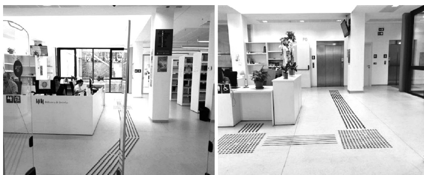
Figura 2. Universidad de Granada. Biblioteca de la Facultad de Derecho