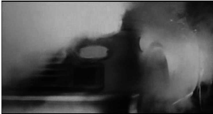
Figura 1. Fotograma del taxi

Scorsese tradujo visualmente la metáfora de Schrader (2018) cuando éste imaginó el germen de su guion como un ataúd de hierro surcando la ciudad ( Figura 1 ).