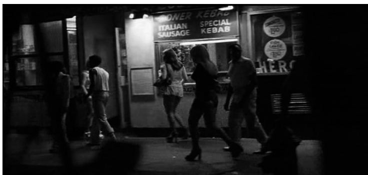
Figura 5. “Por la noche salen bichos de todas clases...”

Schrader sigue la técnica de comunicar al personaje desde dentro hacia afuera, tal como prescribiría Stanislavski (1975), tanto con su flujo de pensamiento como con su percepción.