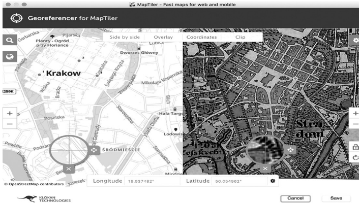
Figura 4. Proceso de georreferenciación con el programa Maptiler