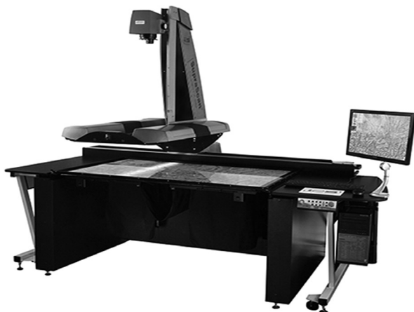
Figura 1. Escaner cenital i2s SupraScan Quartz A0