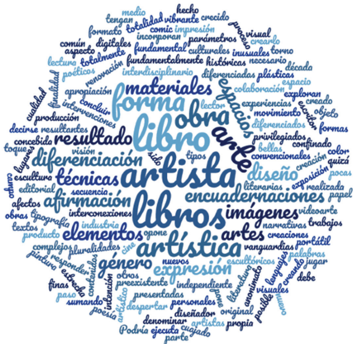
Figura 1. Esquema de recurrencia de términos usados por los autores citados para definir al libro de artista, realizado a partir de la técnica de nube de etiquetas o palabras

De la lista mencionada, se extrajeron las palabras con más recurrencias, lo que permitió construir una definición que incluye los términos fundamentales que caracterizan a un libro de artista: los libros de artista se autodefinen como una obra de arte, su autor parte de un medio de expresión para construir a partir del uso