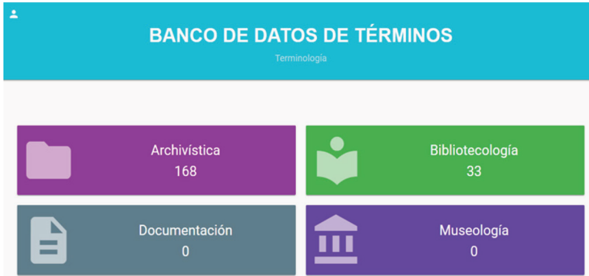
Figura 2. Imagen de la presentación de la página web del BDT-CI. http://bibliotecologia.udea.edu.co/terminologia/sitio/ .