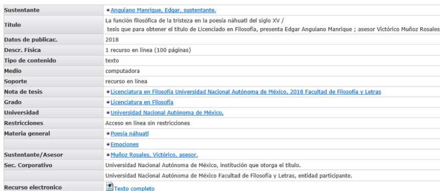
Figura 6. Registro bibliográfico en formato estándar, ejemplo con encabezamientos de materia