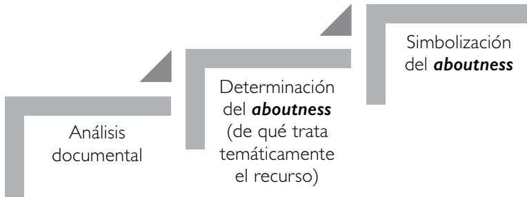
Figura 1. Proceso de indización

La indización de los recursos de información es una actividad esencial de las bibliotecas fundamentada en tres procesos: análisis documental, determinación del aboutness (de qué trata temáticamente el recurso) y la simbolización del aboutness en encabezamientos de materia o descriptores que permitan la recuperación del recurso en un sistema de información (véase figura 1). López Yepes 1 señala que es una técnica documental que describe y representa el contenido de las fuentes de información mediante un número limitado de conceptos extraídos del texto de los documentos (palabras clave) o de sistemas de organización del conocimiento como listas de materia, tesauros, taxonomías, ontologías terminológicas, etcétera, con el claro objetivo de permitir el control y la recuperación de un conjunto documental.