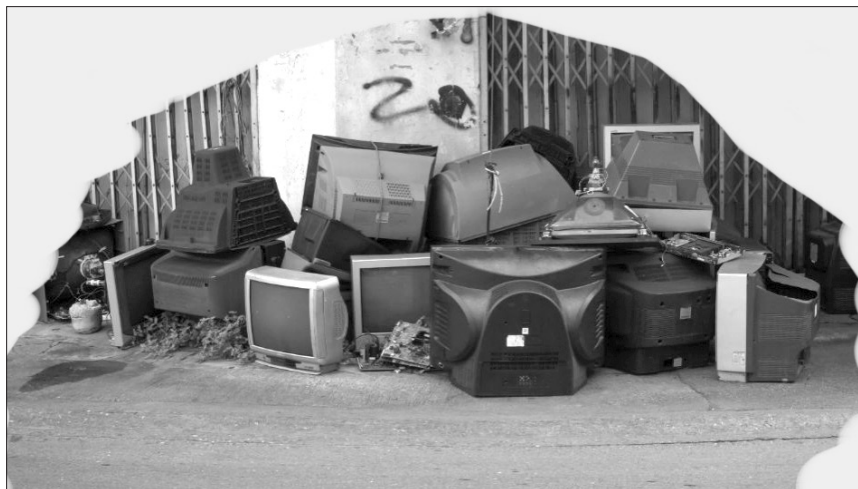
Fig. 4. Los dispositivos desechados

afectación del medio ambiente con el uso de dispositivos electrónicos conectados en red. Los estudios que se están haciendo muestran la contaminación que agregan a la atmósfera y la Bibliotecología debe contribuir a la difusión de estos y a la aplicación de medidas mitigantes del impacto ambiental.