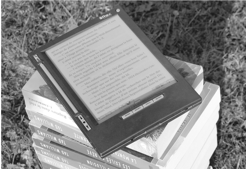
Figura 2. Recurso en papel y recurso en dispositivo electrónico

Por ejemplo, en el aspecto del uso por particulares, la huella de carbono de un lector electrónico se calcula aproximadamente en su fabricación de 168 kg, y la de un libro en 7,5 kg. Para alcanzar la cifra de 168 kilos de una tableta, se necesitarían leer entre 22 y 23 libros. Si se utiliza una tableta para leer menos de esa cantidad de libros, se está desperdiciando y, por lo tanto, agregando mayor huella ecológica en la lectura de libros porque el impacto ambiental es el mismo que si esos libros se hubieran leído de forma impresa. Además, hay que considerar un aspecto muy importante porque producir un solo lector electrónico requiere la extracción de casi 15 kilos de minerales y utiliza alrededor de 284 litros de agua. 11