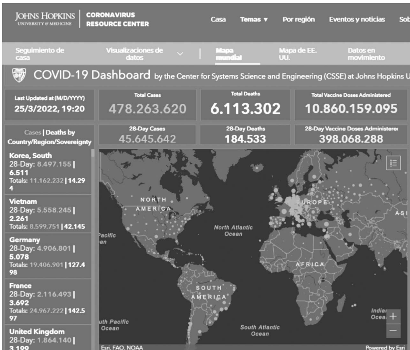
Mapa 4. Tablero de visualización de datos. Centro de Recursos sobre Coronavirus.