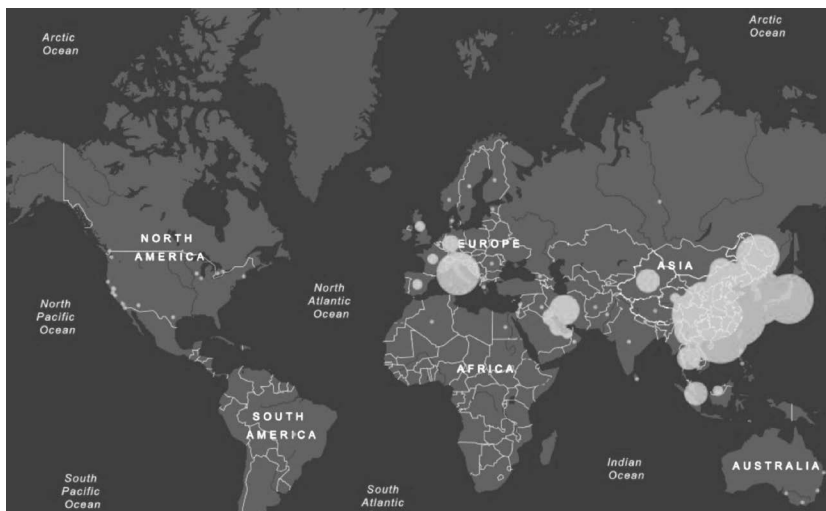
Mapa 3. La Gripe Española. Influenza.