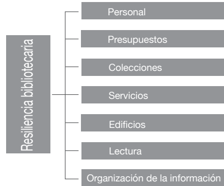
Figura 5. Elementos de la biblioteca que deben ser resilientes