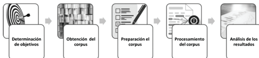
Figura 1. Etapas de la minería de texto

Desde el punto de vista procedimental, la minería de textos representa un proceso de extracción de información, formado por varias etapas. En la presente investigación, el proceso aplicado se constituye de las siguientes etapas ilustradas en la Figura 1 .