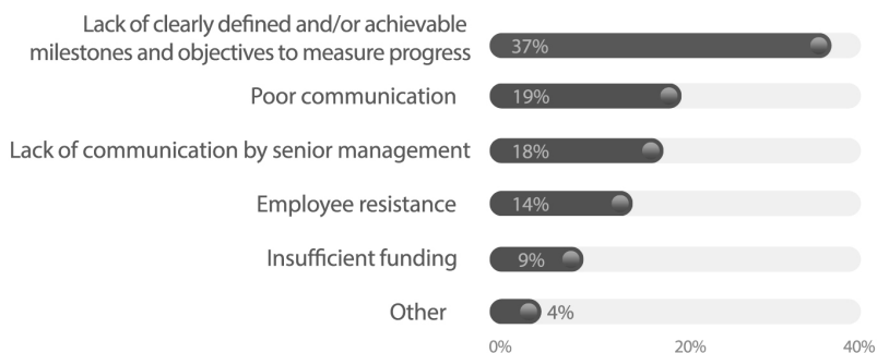
Figura 1. Factores de fracaso, según líderes ejecutivos de proyectos

En el Pulse of the Profession 2023 , los líderes de proyectos «[...] rated communication, problem-solving, collaborative leadership and strategic thinking as the most critical power skills in helping them fulfill organizational objectives» (Project Management Institute 2023, 5), habilidades que ocupan los primeros puestos de importancia a nivel global (véase figura 2). Para el año 2017, el PMI expresó que un futuro desafío para las organizaciones era la comunicación; un quinquenio después, consideran a la comunicación, la resolución de problemas, el liderazgo colaborativo y el pensamiento estratégico como elementos medulares para el éxito de los proyectos, productos o servicios.