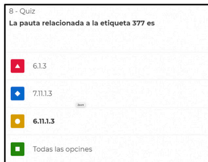
Figura 1. La pauta relacionada a la etiqueta 377 (Kahoot!)

correcta. En la figura 1 se les pregunta a los alumnos sobre la pauta que RDA aplica para codificar la etiqueta 377 de MARC Bibliográfico.