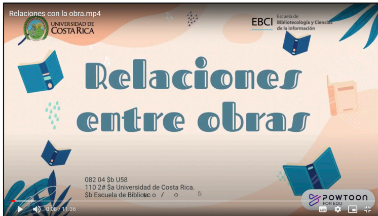
Figura 3. Video "Relaciones entre obras"