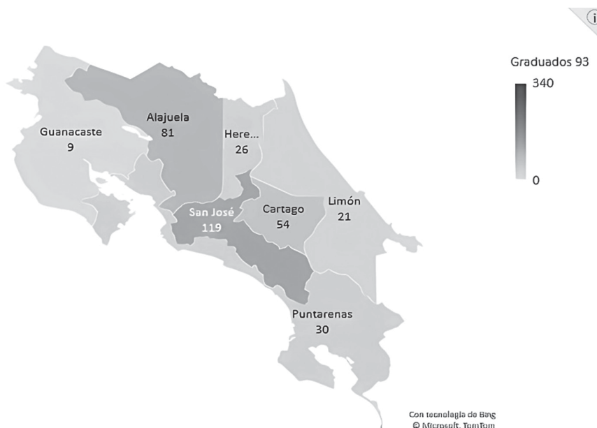
Figura 2. Cantidad de títulos otorgados, código 93, periodo 2014-2021

Fuente: Elaboración propia de los datos de graduación UNED, marzo de 2022.