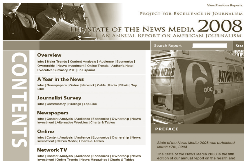
Fig.1. The State of the News Media 2008

Peor situación atravesaba la documentación (Marcos Recio, 1999): la mayoría de los periódicos carecían de un centro de documentación y a lo más que se podía aspirar era a contar con una serie de carpetas con recortes de otros periódicos de la competencia y algún artículo de opinión que pudiera servir para luego escribir el editorial. Al mismo nivel que el texto, se encontraba la fotografía, si bien una parte de los periódicos hacía un seguimiento de las imágenes personales más importantes y comunes en cada una de sus ediciones (léase gobernador, alcalde, presidente y/o entrenador del equipo de fútbol, alguna celebridad, e imágenes de los recursos de las diferentes instituciones) (Marcos Recio, et al. , 1999, 2004, 2008).