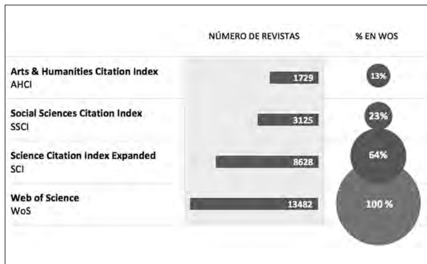
Figura 1. Representatividad de revistas de Humanidades en la WoS

Como ya hemos comentado en la introducción, las bases de datos de la WoS se crearon a partir de un modelo de evaluación de la actividad investigadora para los ámbitos de las ciencias experimentales, donde un gran número de revistas contaban con indicadores cuantitativos como los que utiliza el índice JCR . Como consecuencia, la cobertura de revistas científicas es muy desigual entre los ámbitos de las Ciencias y las Humanidades, o incluso las Ciencias Sociales. La Figura 1 muestra el número de revistas en cada una de las bases de datos de la WoS y en ella se puede observar que del total de revistas incluidas en la WoS sólo un 13 % corresponde a Humanidades ( AHCI ), mientras que las revistas del ámbito de las Ciencias Experimentales ( SCI ) representa un 64 % del volumen total.