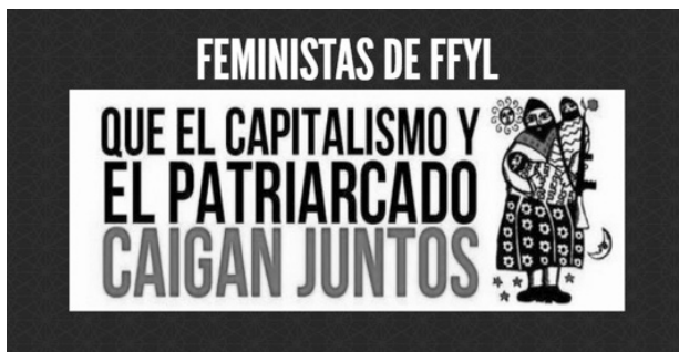
Imagen 16. Una de las demandas más frecuentes en los movimientos feministas se vincula con la visibilización de casos de desapariciones de mujeres, como el de Mariela Vanessa, estudiante de la FFyL, UNAM

Imagen 15. Igual que otros movimientos, los del feminismo se articulan con otros, como por ejemplo el movimiento altermundista y el movimiento zapatista