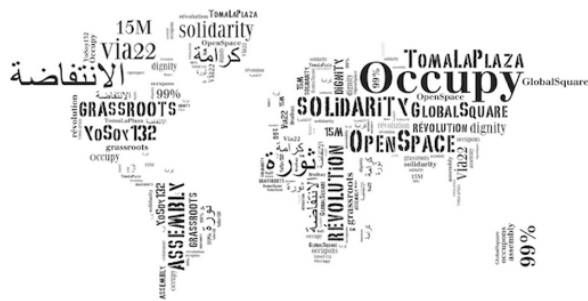
Imagen 2. "Otro mundo es posible", lema simbólico global del movimiento altermundista