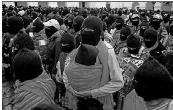
Imagen 5. Concentración magna del movimiento zapatista