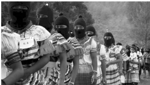
Imagen 7. Representación del movimiento zapatista desde la perspectiva femenina

Imagen 6. Marcha de mujeres zapatistas. Las mujeres tienen un papel crucial en el movimiento zapatista.