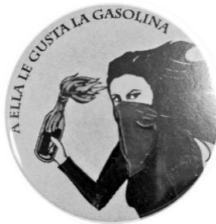
Imagen 14. “Los derechos no se piden... se toman”, consigna recurrente en los movimientos feministas.