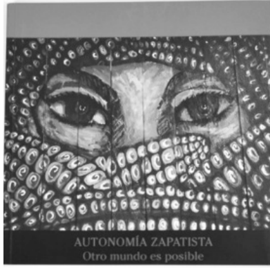
Imagen 3. El movimiento altermundista es un movimiento de movimientos que aglutina decenas de movimientos específicos como, por ejemplo, el Movimiento zapatista