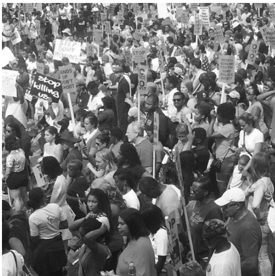
Imagen 9. Black Gay Lives Matter, que representa la lucha por los derechos humanos y civiles de las comunidades LGTBTTI en el marco del Movimiento Black Lives Matter