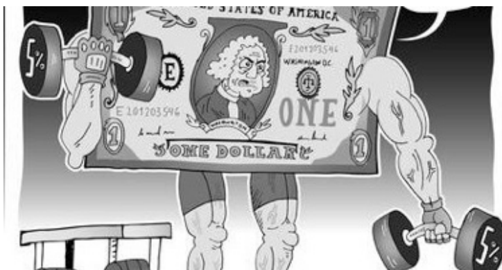
Imagen 17. Ganando fuerza