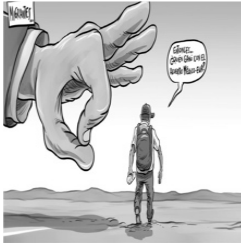
Imagen 1. Migrantes

Fuente: Caricaturista Rictus. Cartón publicado en El Financiero 101619. Elaborado por Salvador Mürdok Heras.