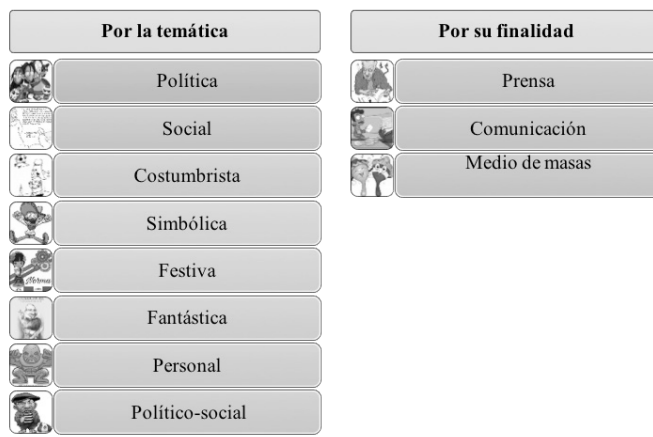
Imagen 4. Tipología de los memes