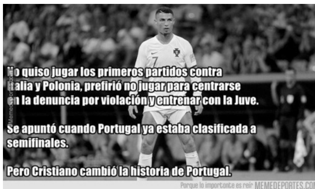
Imagen 16. Ya nos lo vendieron