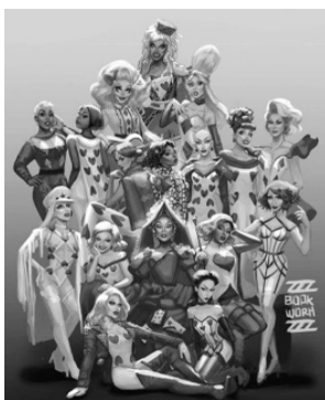
Imagen 7. Book worm

A continuación, se presentan algunas caricaturas y memes . Las caricaturas y los memes son una representación, en algunos casos grotescas y burlonas de las personas o personajes en boga de la sociedad o política.