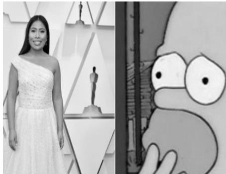
Imagen 12. Yalitza y el Óscar