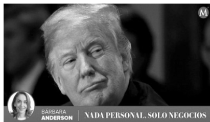
Imagen 10. Nada personal