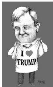
Imagen 9. Lo que faltaba

Fuente: Cartón de Galino. @El_universal_Mx 100619