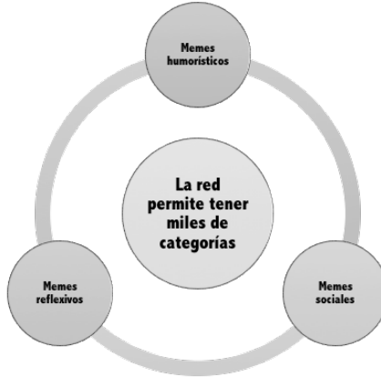
Imagen 5. Clasificación de los memes

A las personas que se dedican a realizar caricaturas de forma profesional y no profesional, se les denomina caricaturistas. Algunos no están de acuerdo con el término moneros . Actualmente, también se les denomina “reporteros visuales”. En el contexto de los memes , encontramos los siguientes (Imagen 5):