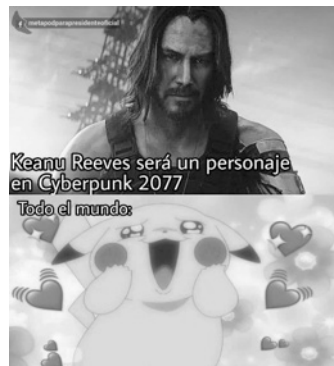
Imagen 14. Keanu Reeves

Fuente: Cartón de @alarcaondibujos. ElUniversal_Mx. 100619