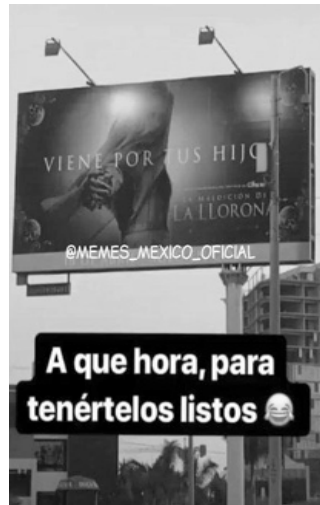
Imagen 2. La llorona