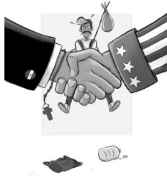
Imagen 11. Acuerdos