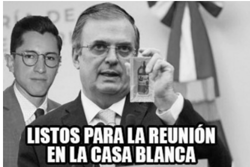
Imagen 18. Marcelo Ebrard