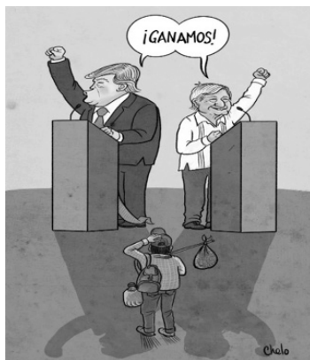
Imagen 15. Acuerdo momentáneo