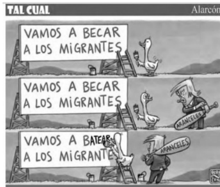
Imagen 13. El acuerdo de la 4T

Fuente: Cartón de @alarcaondibujos. ElUniversal_Mx. 100619