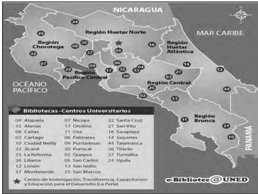
Mapa 1. Centros Universitarios