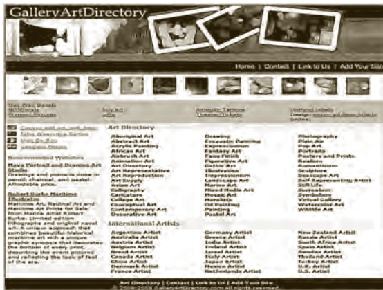
Gallery Art Directory