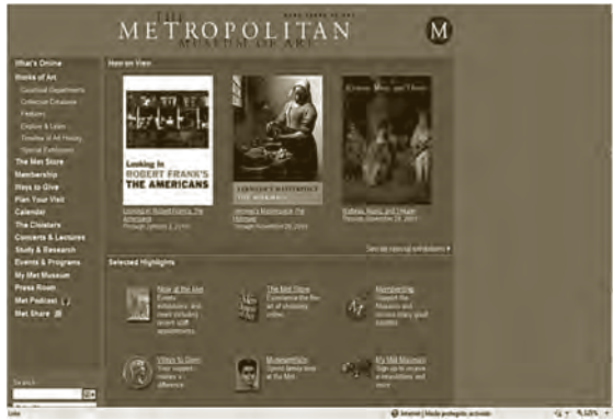
The Metropolitan Museum of Art