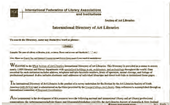
International Directory of Art Libraries

Como se puede observar, los recursos mencionados ofrecen una amplia variedad de enlaces de información sobre arte y todos ellos resultan útiles para cualquier usuario buscando información sobre el tema. Cabe señalar que estos directorios muestran una organización, ya sea por países, por artistas, o bien por temas.