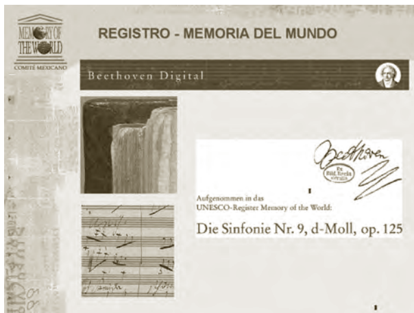
Alemania. Manuscrito de música