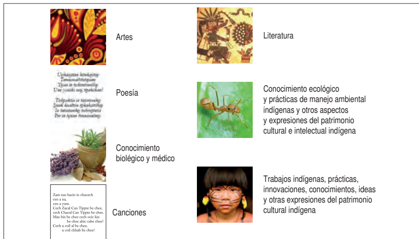
Figura 2. División de la Propiedad Cultural e Intelectual Indígena