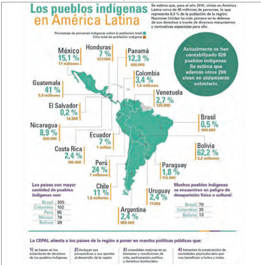
Figura 4. Los pueblos indígenas en América Latina

Fuente: CEPAL [en línea], http://www.cepal.org/es/infografias/los-pueblos-indigenas-en-america-latina