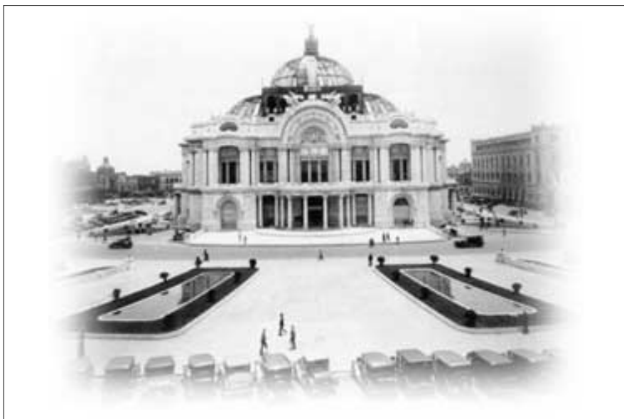
Palacio de Bellas Artes primera sede de la Escuela Nacional de Biblioteconomía y Archivonomía 3

Como producto de este congreso se realiza y propone el plan de estudios que debiera seguir la Escuela, una vez aprobado. La tercera escuela del área se inaugura el 20 de Julio de 1945 en el Palacio de Bellas Artes como una dependencia del Departamento de Bibliotecas de la SEP para responder a la necesidad de capacitar a los bibliotecarios empíricos que prestaban sus servicios en esa dependencia. Para lograr esta capacitación se ofrecieron cursos de “... profesor, subprofesor y técnicos en biblioteconomía y archivonomía, manteniendo esta orientación hasta el año de 1952 en que fue establecido el grado de bibliotecario técnico, cuya duración era de dos años y como requisito de ingreso se exigía haber terminado la secundaria, o en su defecto, haber trabajado en una biblioteca por un mínimo de dos años;