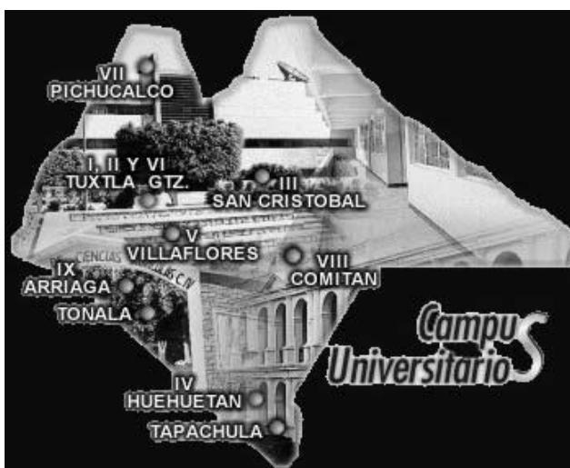
Mapa de ubicación de los Campus Universitarios de la Universidad Autónoma de Chiapas 5

de 1990), y las de las personas interesadas en las carreras de la universidad de los estados colindantes. Su gran demanda educativa se ve reflejada en los datos del periodo 1986-1998, en donde 70,035 aspirantes elaboraron la solicitud respectiva de ingreso; de éstos, y de acuerdo a la capacidad de la universidad, se aceptó a 33,731 alumnos en ese periodo. La planta docente de la universidad en 1992 era de 739 profesores, en 1997 eran 1,126 y para 1998 ya se contaba entre los docentes con 168 maestros y 32 doctores. 4