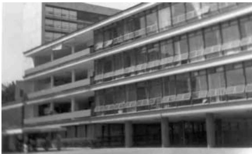
Fig. 2 Facultad de Filosofía y Letras en donde se encuentra ubicado el Colegio de Bibliotecología.

En 1979, el Colegio de Bibliotecología se traslada a la Facultad de Filosofía y Letras, dividiendo el acervo que tenía en su laboratorio en dos partes; una compuesta por los sistemas de clasificación y reglas de catalogación, se colocaron en un salón que pudiera servir como laboratorio y otra parte fue integrada al acervo de la biblioteca “Samuel Ramos”.