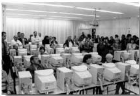
Fig. 3 El laboratorio del Colegio de Bibliotecología 13