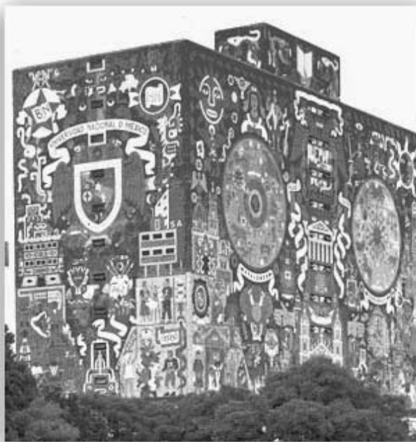
Fig. 1. Biblioteca Central de la UNAM, en la que se ubicó al Colegio de Bibliotecología 3

En sesión de Consejo Técnico del 11 de abril de 1975, la Facultad de Filosofía y Letras suprime la licenciatura en Archivología y crea la maestría de la misma especialidad, aunque la ausencia de alumnos dio fin a dicha maestría.