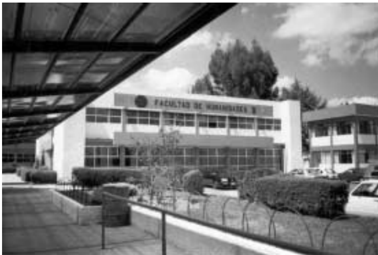
Fig. 1 Facultad de Humanidades de la UAEM

La Licenciatura en Ciencias de la Información Documental se cursa en diez semestres (cinco años) en sistema escolarizado, con horario de lunes a viernes de 16:00 a 21:00 hrs., y los sábados de 09:00 a 13:00 hrs.