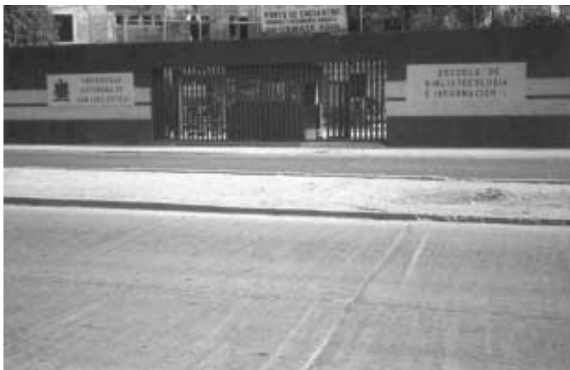
Fig. 3 Actuales instalaciones de la Escuela de Bibliotecología e Información.