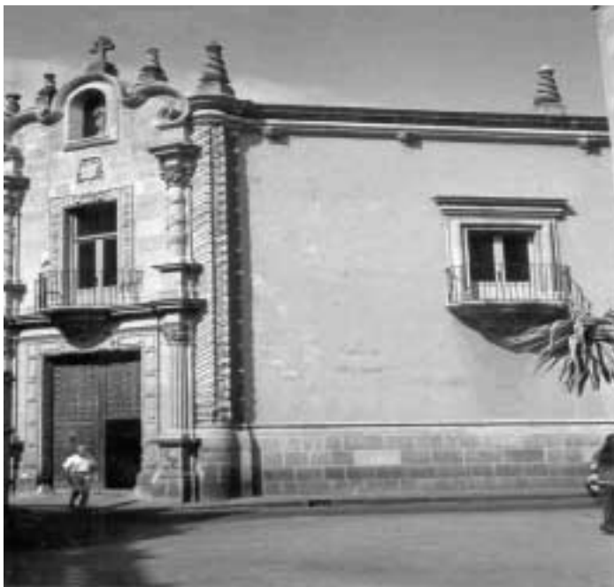
Fig.2 Segundas instalaciones de la licenciatura en biblioteconomía